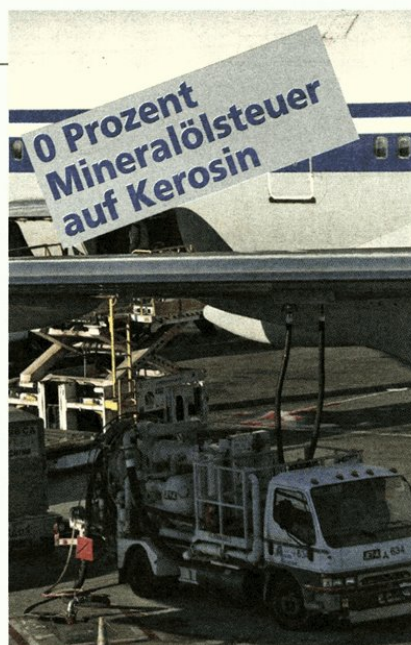
Bei der Festlegung von Steuersätzen haben die Gesetzgeber im Parlament viel Spielraum. Allgemeinen Sachlichkeitsüberlegungen sollten Unterschiede aber schon entsprechen.

fassungsgesetzes, der den Gesetzgeber verpflichtet, Gleiches gleich und Ungleiches ungleich zu behandeln. „Letztlich ist im Abgaberecht dem Gesetzgeber aber ein weiter Ermessensspielraum eingeräumt“, sagt der Rechtsexperte. Von ihrer Zweckrichtung als Einkommens-Verwendungssteuer sei die Umsatzsteuer nicht gut darauf ausgerichtet, ökologische Aspekte zu berücksichtigen. Bestimmungen mit sozialem Charakter könne das Umsatzsteuergesetz trotzdem, etwa unechte Steuerbefreiungen im Gesundheitswesen, bei Kindergartenleistungen oder eben bei der Differenzierung der Steuersätze.